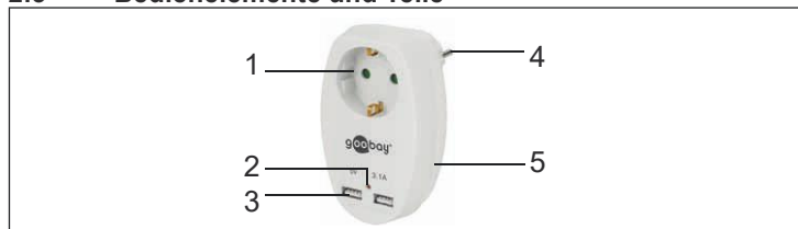
Tab.1: Bedienelemente und Teile